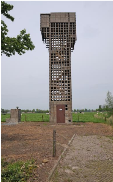
De toren aan het toegangspad vanaf de Brierversweg. Links ervan de toegang tot de BB atombunker.