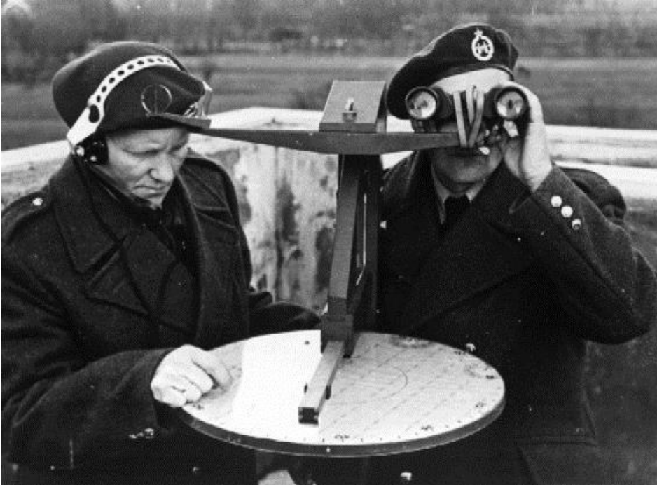
Luchtwachtpost met luchtwachtinstrument: meettafel en richttoestel

De luchtwachtposten werden waar mogelijk ingericht op bestaande gebouwen, zoals (water)torens, molens en industriële gebouwen. Deze opbouwen, waarnaar nog geen onderzoek is gedaan, blijven in dit rapport verder buiten beschouwing. Daarnaast werden er nieuwe torens ontworpen en geconstrueerd, ook wel 'raatbouwtorens', naar het gebruikte bouwsysteem, of 'eigen torens' genoemd. Van de 275 posten werden er 137 ingericht op bestaande gebouwen en werden er 138 nieuwe torens gebouwd.