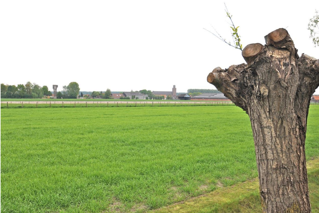
Links de luchtwachtoren en rechts de andere toren van Eede, behorend bij de (wederopbouw)kerk van het dorp. De luchtwachtoren bepaalt mede de noordelijke contouren van het dorp.