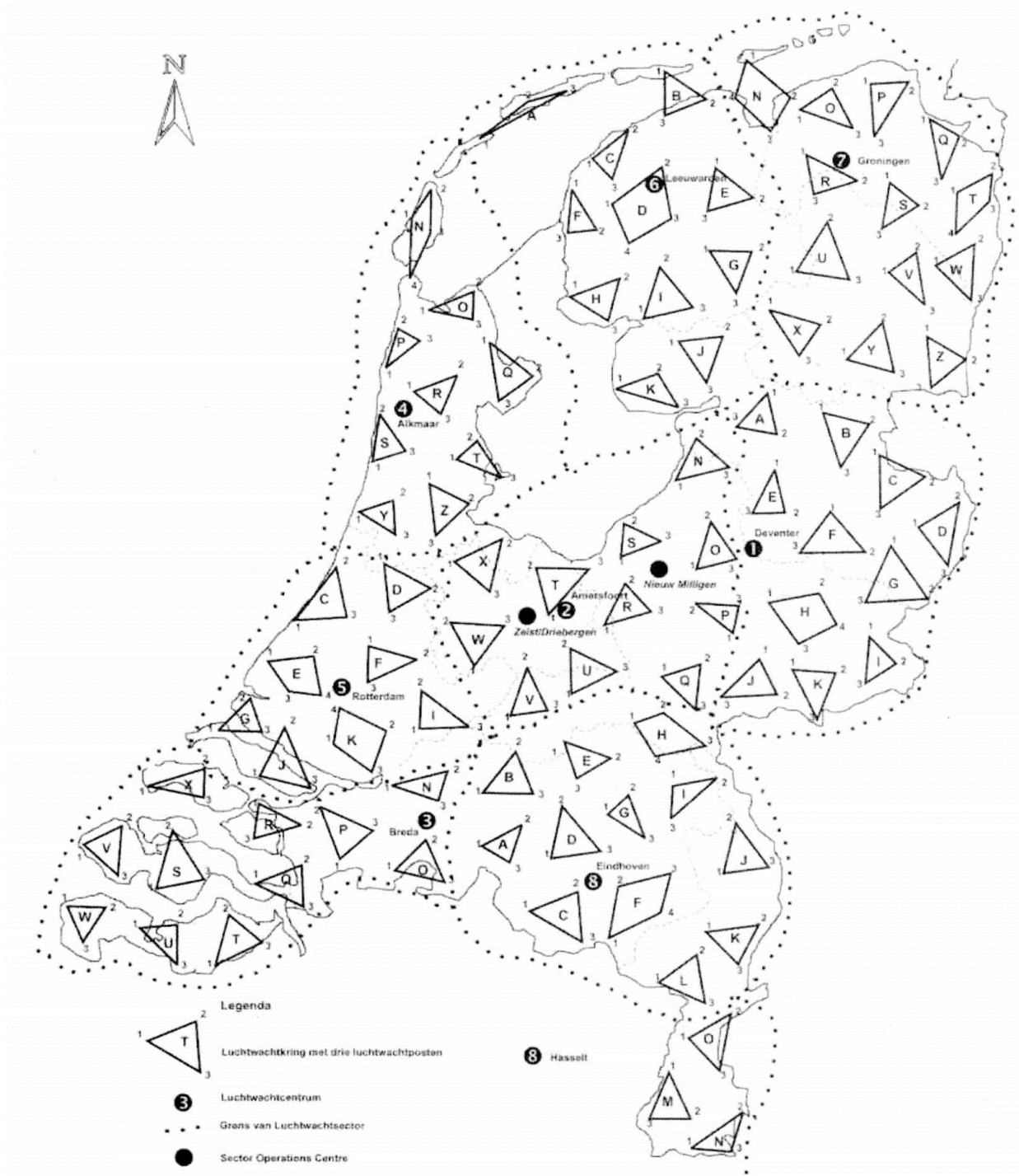
Het landelijk dekkend netwerk van het KLD met 275 luchtwachtposten