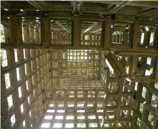
De raatbouwconstructie vanaf onderen gezien

Door het modulair systeem konden maar liefst 23 varianten gebouwd worden, variërend in hoogte van 2,52 meter tot 31,02 meter, telkens met een verschil van 1,14 meter; de modulaire maat. Deze maat werd bepaald door drie betonraten, elk 0,35 meter groot. De hoogte van de toren in centimeters werd tevens gebruikt als typeaanduiding van de toren. De opgegeven hoogte is het niveau van de vloer van de observatiecabine boven het maaiveld plus een voetstuk van 0,24 meter. Torens die hoger waren dan 19,06 meter werden beneden op de hoeken voorzien van steunberen, die eveneens bestonden uit raatbouwelementen. De onderste acht raten van de toren en de steunberen werden aan de buitenzijde betegeld met betonnen tegels om het inklimmen vanaf de buitenzijde tegen te gaan. Ook de uitkragende observatiecabine bovenin de toren was van binnen en buiten betegeld om de inwerking van scherven en exploderende projectielen tegen te gaan.