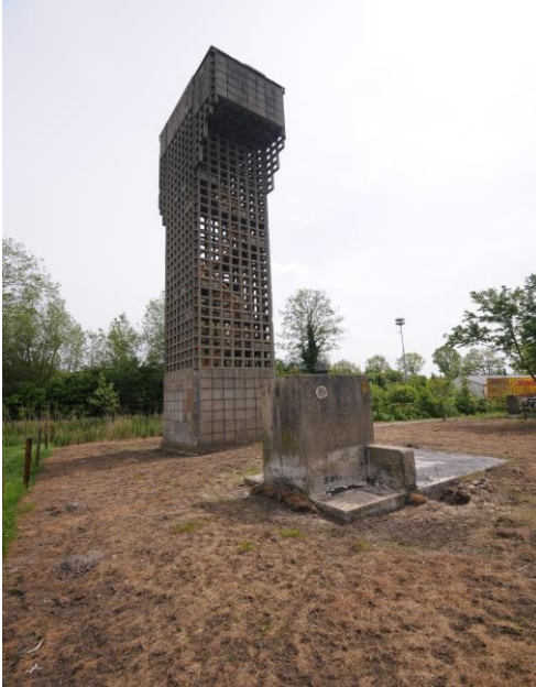
De bunker met toren.