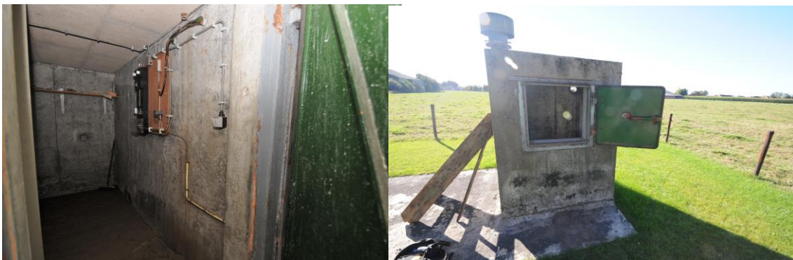
Interieur en toegang bunker